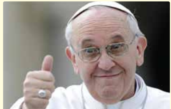
프랜치스코 교황, 2023.8.